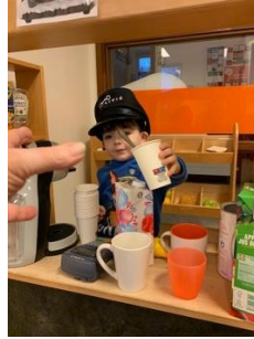
Koek en Zopie kraam