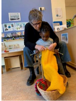
Samen een warme sjaal breien