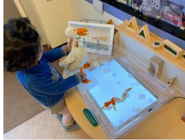
schaatsen op het ijs