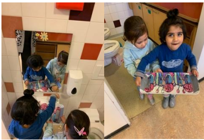
water naar de vriezer