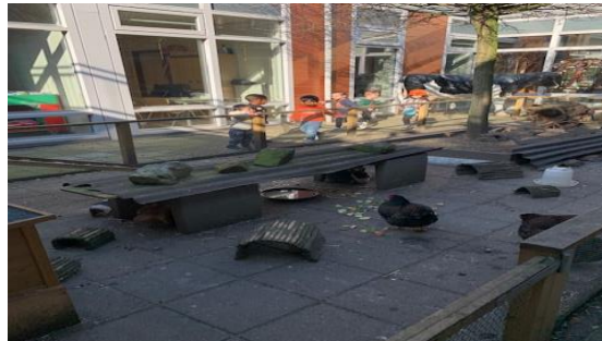
een kijkje bij de kippen in de dierenpatio

Van de zadjes en de bloemetjes naar 'Jonge dieren' en wat maken we veel plezier! Afgelopen week is de bouwhoek een weide voor de (jonge) dieren geworden en daar hangt aan de muur ook een heuse koe die vanaf deze week echt gemolken kan gaan worden...moehhh ☺