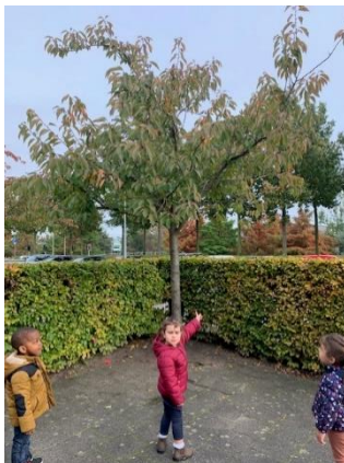
Dáár...groene en gele blaadjes!

De bouwhoek is nu omgetoverd naar een bos en missen we best nog wel wat mooie bladeren, takken, eikels, kastanjes en andere spannende bos geheimen. Wij hopen dat iedereen van boswandelingen houdt en wat voor de BOS bouwhoek meeneemt.