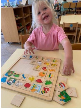
Liv is op zoek naar 'dezelfde'