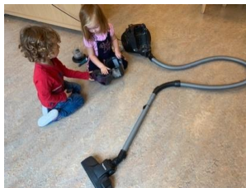
Jon en Julie ontdekken dat het een échte stofzuiger is

Natuurlijk wordt er ook buiten weer volop genoten van alles wat er maar op je pad komt