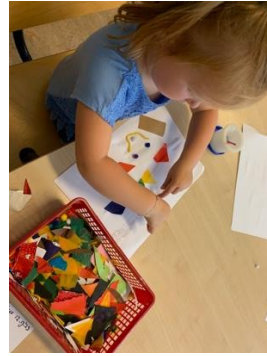
Julie plakt er 'betekenisvol' op los