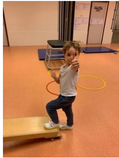
gymmen is top!