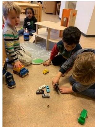
de undercover politiemotor is goed gekeurd☺

Helemaal gerustgesteld gaan ze weer verder met hun politie spel en de vrede tussen de 2 politiemannen is wedergekeerd en hebben er een 'vreemd' woord bijgeleerd.