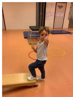
gymmen is top!