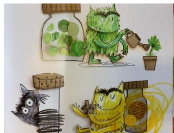
bang kalm blij